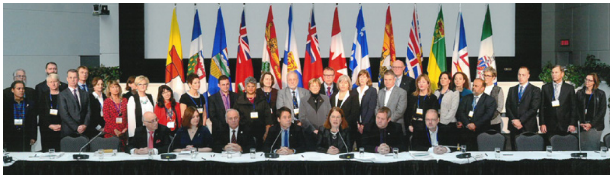
Figure 2. Participants au sommet sur les opioïdes, 19 novembre 2016

De son côté, le sommet, qui a eu lieu le lendemain, rassemblait un groupe plus restreint de représentants d'une quarantaine d'organisations de professionnels de la santé, d'organisations nationales, d'organisations pancanadiennes sur la santé, d'organismes de réglementation, de décideurs et de ministères provinciaux et territoriaux de la Santé autorisés à prendre des engagements précis et concrets pour faire face à l'usage problématique d'opioïdes au Canada. Une des principales réalisations de ce sommet a été l'approbation de la Déclaration conjointe, qui reflète l'engagement des partenaires à agir contre la crise. Les participants au sommet (voir la figure 2), y compris la ministre fédérale de la Santé et neuf ministres de la Santé provinciaux et territoriaux, ont tous aidé à formuler la Déclaration conjointe, qui compte notamment des livrables et échéanciers précis. Les organismes participants ont convenu de travailler, dans les limites de leurs domaines de responsabilité respectifs, à réduire les méfaits associés aux opioïdes au moyen de mesures rapides et concrètes qui produisent des résultats clairs. À noter que les organismes ayant signé la Déclaration conjointe se sont aussi engagés à produire des rapports d'étape sur les progrès réalisés.