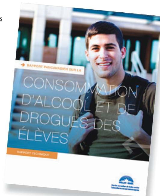
Rapport du CCLAT et du Groupe de travail ECDE

Les taux de consommation variant beaucoup, le CCLAT recommande de cibler les activités de sensibilisation à l'alcool sur les élèves en début de secondaire, et les initiatives de réduction de l'usage et de la fréquence sur ceux en fin de secondaire. Lisez le rapport intégral. >