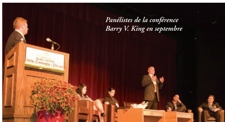
Panélistes de la conférence Barry V. King en septembre

Vous avez manqué la conférence? Visionnez-la en ligne. >